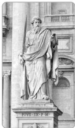
Rzeźba św. Pawła dłuta Adama Todoliniego przed Bazyliką św. Piotra na Watykanie

że ktoś musi nas nauczyć. Mądrość przychodzi od innych, jest przekazywana od mądrzejszych od nas samych. Dlatego idąc do szkoły muszę zaufać nauczycielom jako mądrzejszym od siebie. Będąc dzieckiem zawieram drogę mojego rozwoju mądrości rodziców. Tylko ten, kto w ten sposób „jest głupi”, może stać się mądry. Ważna to lekcja nie tylko dla uczniów. Mądrość największa przychodzi ostatecznie od Boga. Przychodzi jako dar, jako oświecenie rozumu i przemiana serca. Przychodzi przez postugę Kościoła, nazywanego Matką i Nauczycielką („Mater et Magistra”). Aby się napełnić mądrością trzeba być człowiekiem pokornym. A z tym mamy problem. Więc warto posłuchać rady starego Pawła. Stań się głupi, aby nabyć mądrości nie z tego świata. Daj się poprowadzić Mater et Magistra!