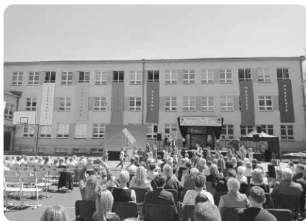
Uroczystości jubileuszowe odbyły się na boisku szkolnym 3 czerwca 2022 r.

Tak, to był trudny czas. Coś się na pewno zmieniło, świat już nie jest taki sam... Widać to po sposobie życia, szczególnie w relacjach międzyludzkich.