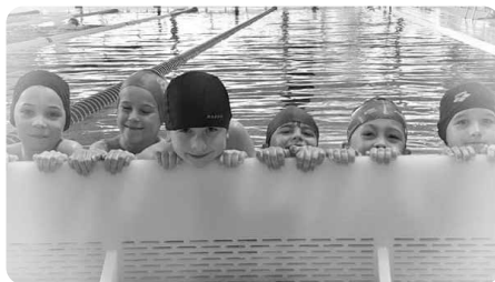
Uczniowie klasy sportowej na Basenie Brynów

Niestety tak... Odeszło dość sporo nauczycieli i to z różnych powodów. Jedni na emeryturę, inni ze względów zdrowotnych, a jeszcze inni z powodów finansowych. Ostatnio znacznie wzrosły ceny paliwa, więc szukają pracy bliżej miejsca zamieszkania. Mam z tego powodu dość dużo problemów, gdyż trudno skompletować nauczycieli do wielu przedmiotów. Nie zgłaszają się też absolwenci studiów o kierunku nauczycielskim, gdyż jest ich coraz mniej. Jako nauczyciel akademicki obserwuję, że zainteresowanie edukacją wczesnoszkolną jeszcze jest, ale brakuje nauczycieli takich przedmiotów jak: informatyka, biologia, matematyka, chemia i fizyka.